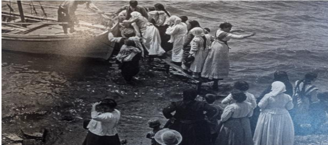
Asia Menor, 1914