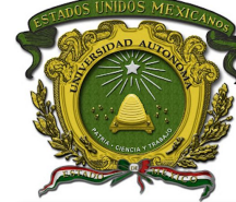
Universidad Autónoma del Estado de México