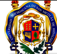
Universidad Michoacana de San Nicolás de Hidalgo