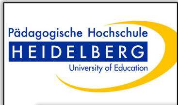
Universidad de Educación de Heidelberg