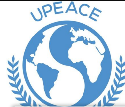
Universidad para la Paz